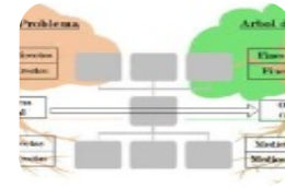
Traslado del Árbol de Problemas a un Árbol de Objetivos, identificando Medios y Fines