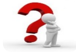
Identificación y construcción del Problema