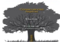
Construcción del Árbol de Problemas identificando Causas y Efectos