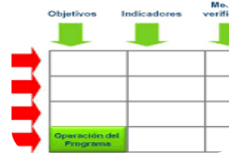
Traslado del Árbol de objetivos a la MIR, donde se identifican, Fin, Propósito, Componentes y Actividades